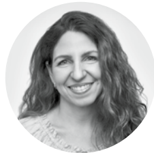
Catherine, 45 ans Propriétaire d'entreprise

Bénéficiez d'une assurance permanente qui permet de minimiser l'impôt, de maximiser la valeur successorale nette grâce au compte de dividende en capital et d'impacter positivement le bilan financier de votre société. En effet, la valeur de rachat de votre police pourra être considéré comme un actif au bilan de votre société. Après quelques années seulement, la forte croissance des valeurs de rachat de la police renforcera votre bilan et vous permettra d'inscrire un revenu à l'état des résultats.